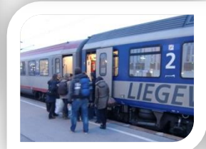
Rückfahrt mit dem Nachtzug nach Köln