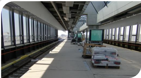
Baustellenführung zur Verlängerung der U-Bahn-Linie 2 nach Aspern (Station Hausfeldstraße). Zwei Fahrstühle sind obligatorisch!