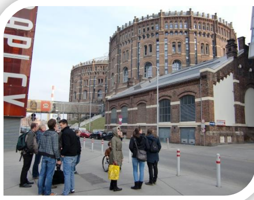
Gasometer-City. Die alten Gasometer schaffen neuen Wohn- und Geschäftsraum mitten in der Stadt.