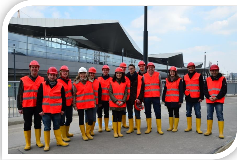
Gruppenfoto vor der Dachkonstruktion des neuen HBF Wien