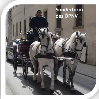
Sonderform des ÖPNV