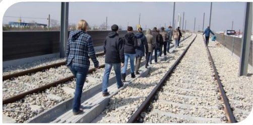
Begehung der Neubaustrasse der künftigen Straßenbahn-Linie 26